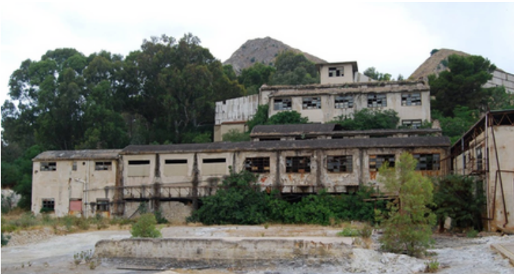
Instalación de flotación aún por restaurar

En Cozzo Disi, los pasajes subterráneos ya existen y son totalmente accesibles: "bastaría con limpiar las vías de acceso y atraer a posibles visitantes".